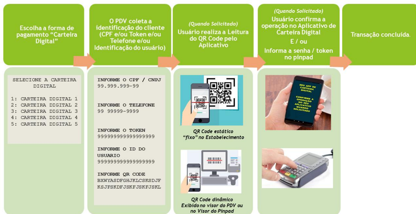
Figura 1 - Fluxo básico de uma transação com Carteira Digital

Em geral, o fluxo de uma transação com Carteira Digital é bem simples, podendo variar de acordo com cada Carteira Digital.